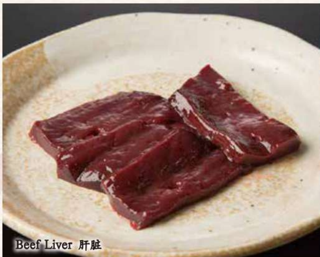
Beef Liver 肝脏