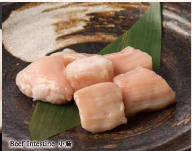
Beef Intestine 小肠

* Tax is included in the price. * 表示价格为含税价格。